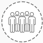
인권침해 요소 점검

그래서 해외 진출한 우리나라 기업들도 현지법 및 국제인권규범에 따른 대응이 필요합니다.